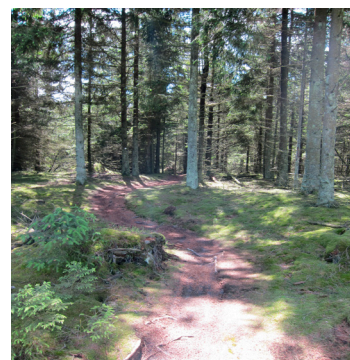
Kort og ruteanvisninger næste side!