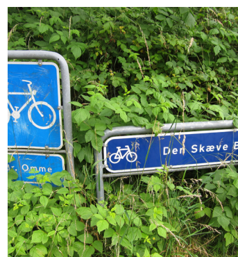
Kort og ruteanvisninger næste side!