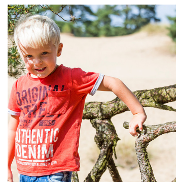
Kort og ruteanvisninger næste side!