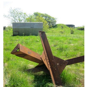
Kort og ruteanvisninger næste side!