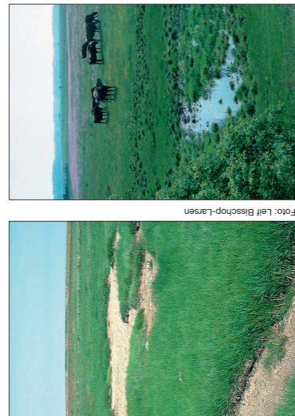
Nu tørrer Maden ud tidligt om foråret - men engens dyr og planter trives bedst, hvis der er fugtigt til dem på sommeren

Skov- og Naturstyrelsen gennemfører naturforbedringer på Helnæs Made. I 1996 lykkedes det i samarbejde med lokale landmænd at gennemføre en jordfordeling, så ca. 200 ha af Maden kunne overgå til Skov- og Naturstyrelsen.