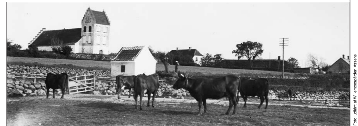
Køer på Maden i 1914 med Helnæs kirke og sprøjtehus i baggrunden

Almindelig Blåfugl er alle vegne på åbne og udyrkede arealer, hvor der gror planter fra ærteblomstfamilien, da det er larvens foretrukne føde.