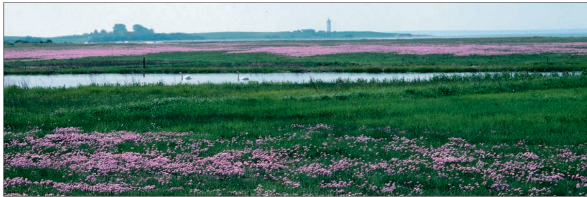
Maden med Engelskræs i maj måned