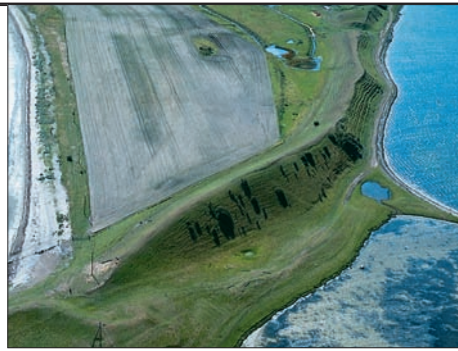
Helnæs ås set fra luften

I stenalderen var Helnæs og Agernæs øer, men de er blevet forbundet med hinanden og Fyn af strandvolde, der er aflejret af nordgående havstrømme.