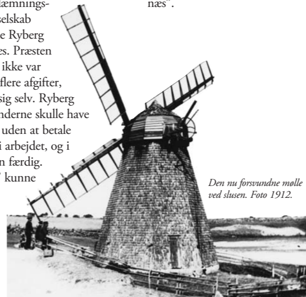
Den nu forsvundne mølle ved slusen. Foto 1912.