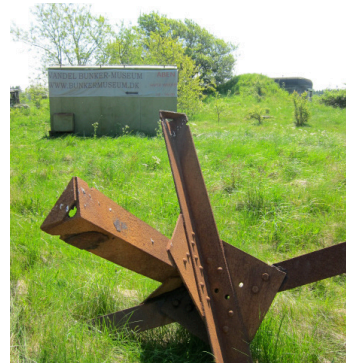
Kort og ruteanvisninger næste side!