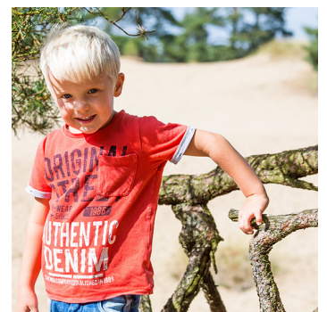
Karte und Weg beschreibung auf der Rückseite!