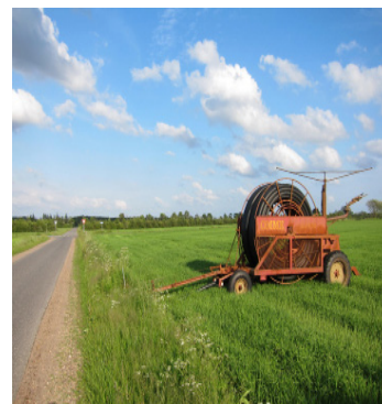
Kort og ruteanvisninger næste side!