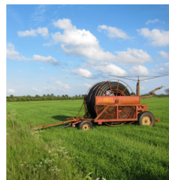
Karte und Wegbeschreibung auf der Rückseite!