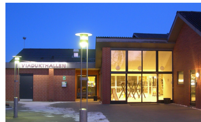
Viadukthallen Filskov, kulturcenter indviet 2004