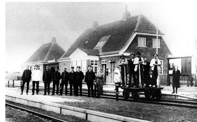
Filskov Station, indviet 1917 og lukket 1971

En næsten helt almindelig landsby, midt i Jylland 15 km fra Legoland og Billund