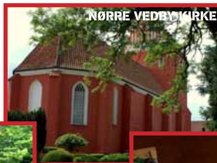
NØRRE VEDBY KIRKE