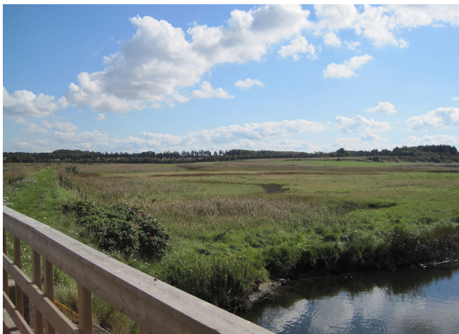
Foto: Udsigt ved slusen ved Lysen Odde/Hjerk Nor