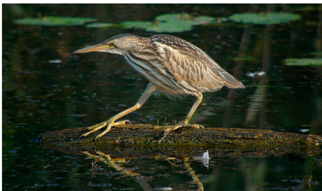
Foto: Ung rørdrum

Fuglelivet på Hjortholm er rigt. Her har fuglene et godt vadeområde, hvor de uforstyrret kan søge føde. Når man kommer gående langs stranden mod Hjortholm, vil der ofte være store flokke af strand- og vadefugle, der letter og flyver over vandet på larmende flugt fra de forstyrrende gæster. Fra de nærliggende sivområder kan man være heldig at høre de dybere lyde fra rørdrum og gøg.