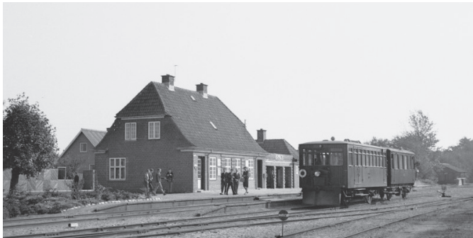
Balling Station 1965, Foto: Erik V. Pedersen

Banens økonomi var i hele perioden betrængt, især fordi manglen på transportkrævende industri i banens opland medførte en særdeles ringe godsbeholdning, og med privatbilismens indtog i starten af 1960'erne blev banens skæbne endeligt beseglet. Den 31. marts 1966 kørte det sidste tog på Vestsallingbanen.