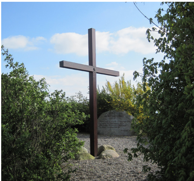
Foto: Mindesten for Grætrup Kirke

Kirkegården blev holdt ved lige i mange år efter kirkens nedrivning. Først omkring 1870 begyndte man at dyrke jorden, hvor kirkegården engang lå.