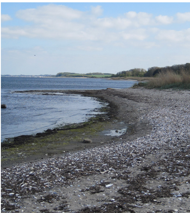
Foto: Stranden ved Grætrup

Kirken kan i dag anes på marken vest for mindepladsen, hvor man kan se kalk- og murstensrester, og en lille del af kirkediget kan endnu ses i mindehaven.