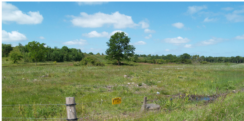
Naturområdet ved Sundsøre

Det er tilladt at færdes i naturområdet under hensyntagen til naturen og kreaturerne. Skive kommune ejer arealet.