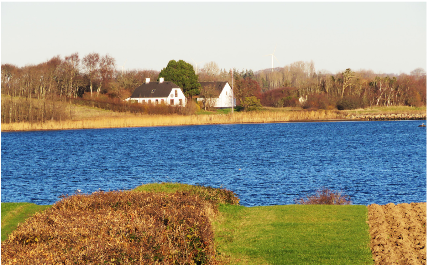
Udsigt fra Bogøvej mod Lindø.

39. Pumpehus. Over for ejendommen Bogøvej 23 kan du studere en pumpestation (med en hjertestarter!) som har tørlagt den sydlige gren af Lindelse Nor.