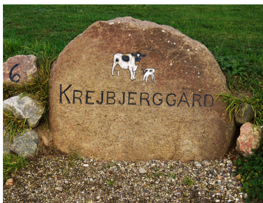
Krejbjerggård byder på bl.a. fodboldgolf og naturlejrplads.

36. Krejbjerggård. Landevejen skifter navn til Langøvej, følg den videre mod nord. Gården på Langøvej 6 er Krejbjerggård, som tilbyder flere former for overnatning, bl.a. i telt på naturlejrplads eller i hytter.