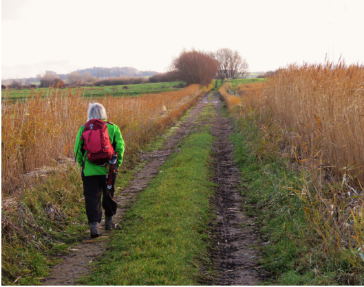
Sådan starter etape 4: På en markvej.

32. Start på Ristingevej. Etape 4 begynder på Ristingevej ca. 300 meter syd for Ristinge Havn.