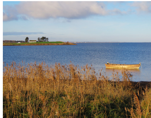
Tv: En lille oase. Th: Udsigt mod Ristinge Havn.