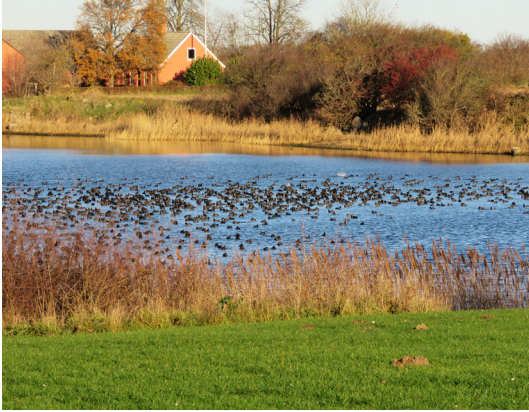
Fugle flokkes i Lindelse Nor.

40. Fantastisk udsigt. Følg Bogøvej mod øst ca. 2 km. I et skarpt sving lige før Bogøvej 27 har du fra en lille bakketop den smukkeste udsigt over Lindelse Nor med de mange småøer - Det Sydfynske Øhav i ministørrelse, er der nogen, der kalder noret.