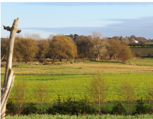
Udsigt fra Helsnedvej.

33. Møllevænget Nyd udsigten mod Ærø, Strynø og Tåsinge, før du ca. to kilometer oppe ad kysten sætter kurs ind i landet ad Møllevænget, som på den første strækning er en markvej, men efter en halv kilometer bliver asfalteret.