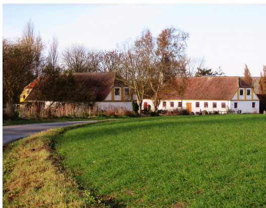
Tv: Den nedlagte skole i Vester Kædeby. Th: Kædebygaard.