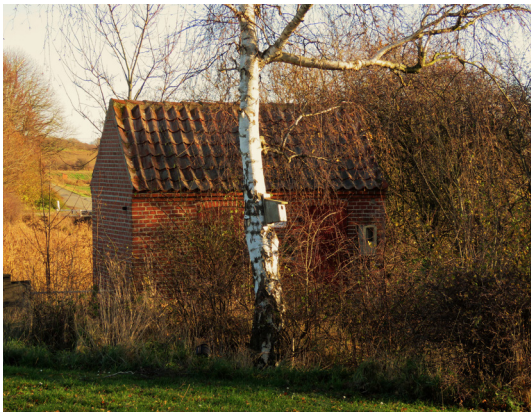
Pumpestationen ved Bogøvej 23.

100 meter nord for kirken: Drej mød øst ad Haugbøllevvej og følg den til T-krydset ved Bogøvej.