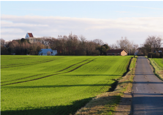
På vej mod Lindelse.

De største øer, Langø (41) og Lindø (42), er beboede og forbundet med kysten med dæmninger.