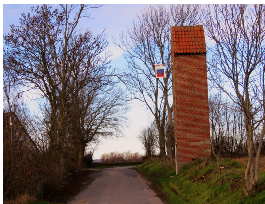
Tv: Det nedlagte transformatorårn - nu kunstårn - på Langøvej.

36. Krejbjerggård. Landevejen skifter navn til Langøvej, følg den videre mod nord. Gården på Langøvej 6 er Krejbjerggård, som tilbyder flere former for overnatning, bl.a. i telt på naturlejrplads eller i hytter.