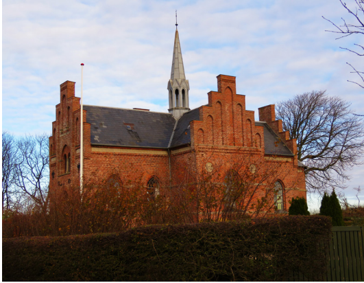
Kædeby Kirke - eller Kædeby Kapel, som kirken tidligere blev kaldt.

38. Kædeby Kirke. Kirken er bygget i 1885. Kun fire år tidligere - i 1881 - havde Ristinge fået sin egen kirke, som ligner den meget, og begrundelsen var begge steder, at der var sket en befolkningstilvækst, og sognebørnene følte, at der var for langt til Humble Kirke, som de hørte under. I de første mange år brugte man betegnelsen "kapel" om de to små kirker, men i de senere år er man altså begyndt at sige Kædeby Kirke (og Ristinge Kirke).