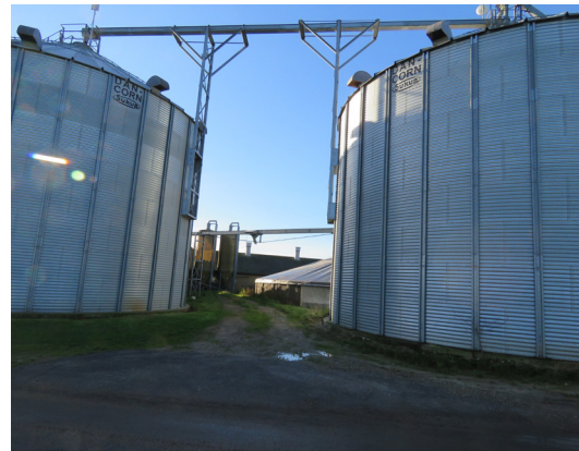
Tv: På dette sted går du ind i landet ad Møllevænget.