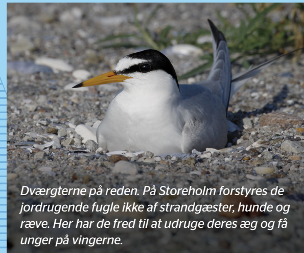
Dværgerterne på reden. På Storeholm forstyrres de jordrugende fugle ikke af strandgæster, hunde og ræve. Her har de fred til at udruge deres æg og få unger på vingerne.