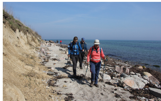
På vej Langeland rundt langs kysten.