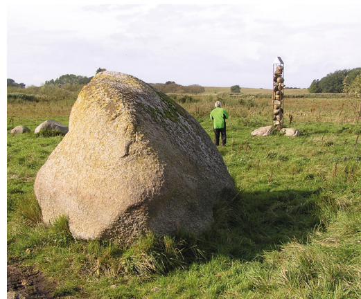
Søstenen ved Snaremose Sø.