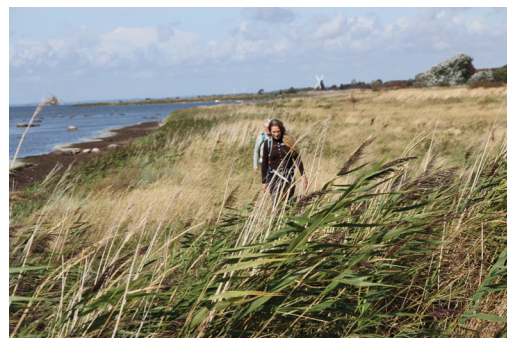
Trampespor langs kysten på Strynø.