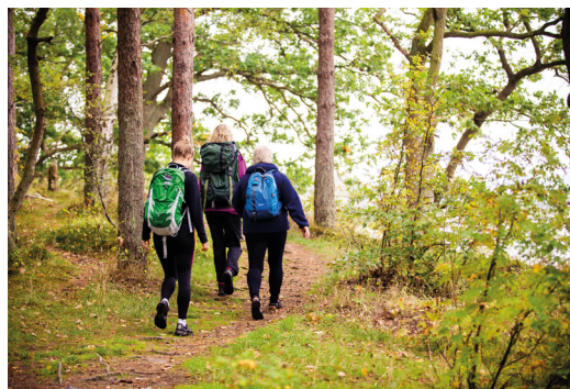
I skovens dybe stille ro.