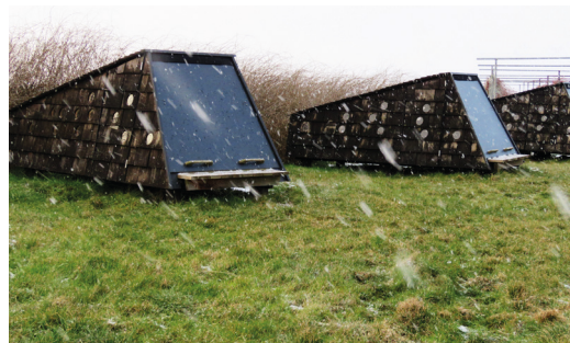
Shelters på Ristinge Havn.