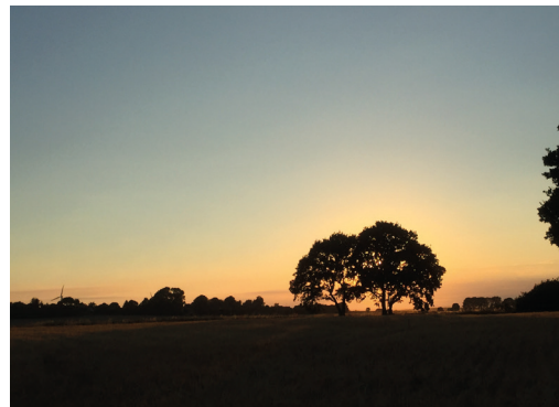
Snødestien går fra Snøde Skole til kysten ved Storebælt.