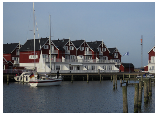
Ildsjælenes Fodspor i Bagenkop fører dig rundt i byen og langs havnen.