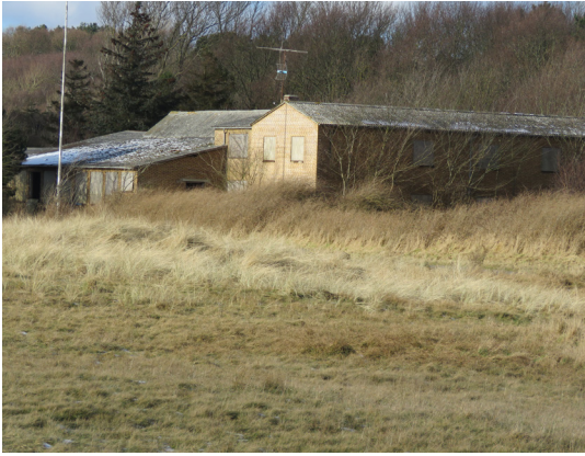
Det tidligere badepensionat Havblik har kendt bedre tider.

28. Havblik. Fortsæt ad stranden til det tidligere badepensionat Havblik, som er dybt forfaldent (2018). Det har stået tomt siden 2006, da det blev overtaget af en nordsjællandsk investor, som ville omdanne det til et fashionabelt badehotel med restaurant. Siden er intet sket.