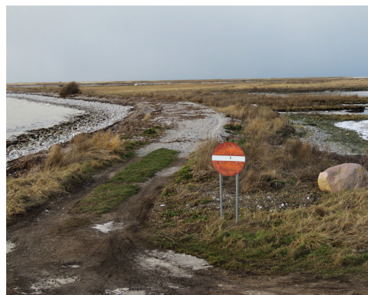
Tv: Udsigt fra Ristinge Klint mod Marstal på Ærø. Skarver holder til på bundgarnspælene.