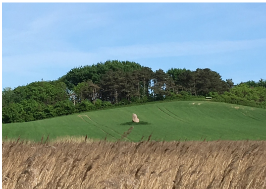
Tyrestenen har måske reddet en ung mands liv!

24. Tyrestenen. Om Tyrestenen hedder det, at en ung knøs engang blev jagtet af en arrig tyr, men reddede sit skind ved at kravle op og sætte sig på toppen af stenen. Den står midt på en mark nord for sommerhusområdet Klintegård og er ikke offentlig tilgængelig, men kan ses fra stien langs stranden.