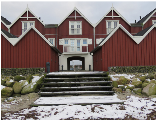
På stranden bag de rød-hvide feriehus på Bagenkop Havn starter etape 3.

21. Feriehus på Bagenkop Havn. Etape 3 starter i Bagenkop - en hyggelig fisker- og ferieby med p-pladser, offentlige toiletter, flere spisesteder, en kro, en campingplads, en god badestrand og fine ferieboliger. Vandreturen begynder lige nord for de rød-hvide ferieboliger på havnen, hvor en trappe fører ned til den fine sandstrand, som har Blåt Flag og en badebro.