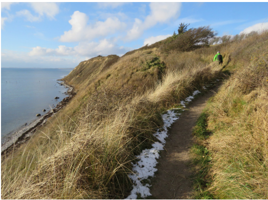
At vandre ad stien på toppen af Ristinge Klint er betagende på alle årstider.

28. Havblik. Fortsæt ad stranden til det tidligere badepensionat Havblik, som er dybt forfaldent (2018). Det har stået tomt siden 2006, da det blev overtaget af en nordsjællandsk investor, som ville omdanne det til et fashionabelt badehotel med restaurant. Siden er intet sket.