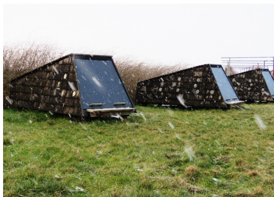
Tre shelters, såkaldte skrubber, ved Ristinge Havn.

Den drejer efter ca. 300 meter mod øst, følger kysten på indersiden af et dige og levner ikke de store udsigter. Men snart kan du se en markant, lav, hvid bygning mod nordøst – den lille Ristinge Havn (se det store foto herunder).