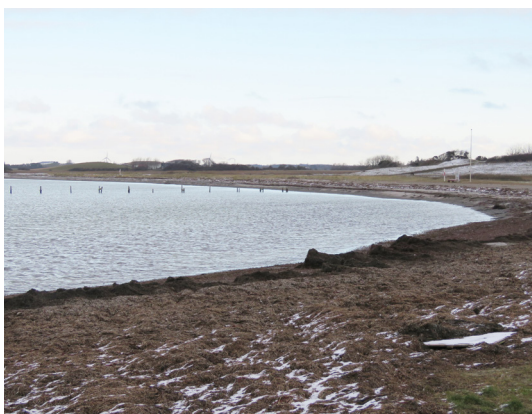
Stranden ved Bagenkop har Blåt Flag.

22. Klise Nor. Følg stranden langs Klise Nor, som er delvist tørlagt. På strandene græsser en mindre flok vilde heste - exmoor-ponyer - året rundt, de er i familie med den store flok, som lever på øens sydspids (se etape 2).