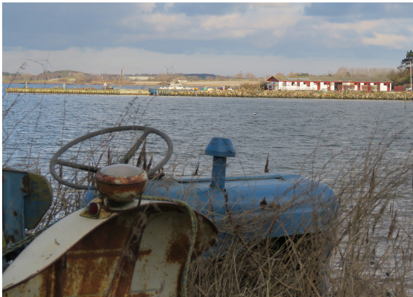
En traktor af ældre dato og udsigt til Ristinge Havn, hvor nogle få fiskere holder liv i erhvervet. I sær om sommeren valfarter fastboende og øens gæster til havnen for at købe frisk fisk og fjordrejer.

Du kan overnatte i tre små shelters, der er adgang til toiletter og mulighed for at købe frisk fisk og rejer, hvis du kommer i sæsonen - og først på dagen.