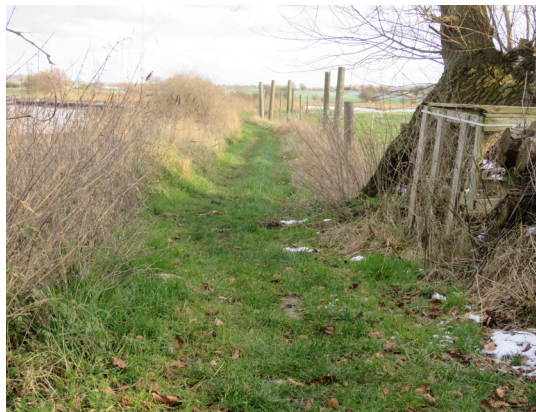
Sti langs kysten fra Ristinge mod Ristingevej.

31. Offentlig sti mod nord. Følg grusvejen Halevejen tilbage mod øst indtil den ved nr. 23 ændrer sig til asfalt og en offentlig marksti fører mod nord.