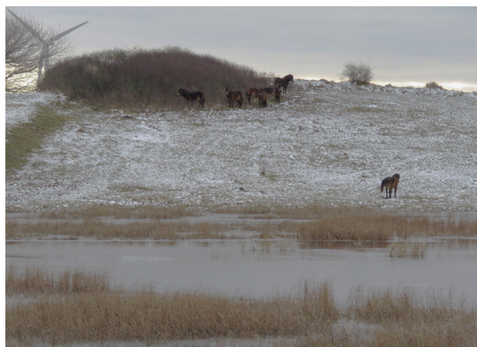
Svært at se, måske - men en flok vilde heste har søgt ly ved en bakked top ved Klise Nor.

Langs Hellenor afgrænses kysten af lave lerkliner, men en fin sti fører dig trygt forbi.