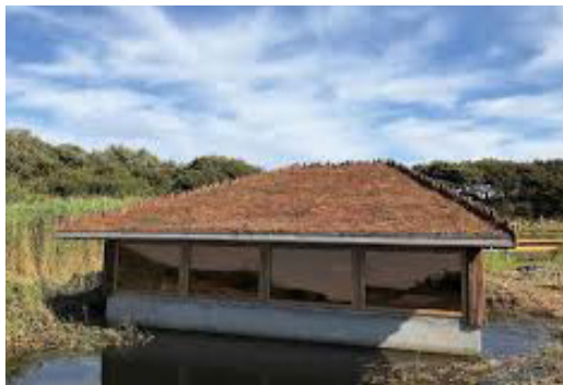
Tv: Tryggelev Nor er et af de mest fuglerige vådområder i Danmark.