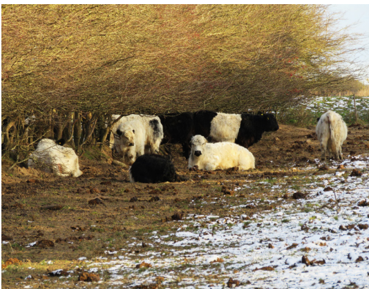
Loddent gallowaykvæg afgræsser overdrevet på Ristinge Klint.

Overdrevet langs stien på Ristinge Klint afgræsses af charmerende, loddent og fredeligt gallowaykvæg.