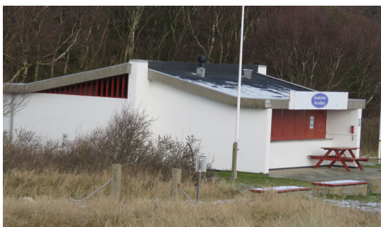
Om vinteren er kiosken ved Hesselbjerg lukket, men om sommeren er der gang i is-salget.

råder i Danmark. Hold især udkig efter ænder og lappedykkere, som sammen med en masse andre fuglearter kan boltre sig i rørskov, på strandeng, overdrev og i krat - og ofte får selskab af grønne frøer og gule engmyrer.