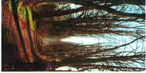
Lammehaven: Alleen består stadig af de nu over 200 år gamle, smukke lindetræer!