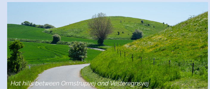
Hat hills between Ormstrupvej and Vesteregsvej

Der Damm zwischen Henninge Nor und Lindelse Nor gehört nicht zu dem Wanderweg des Inselmeeres, aber ein kleiner Teil des Wanderwegs führt an der anderen Seite des Damms weiter und ist mit Klæsø Naturwanderweg verbunden. Laut Naturschutzgesetz dürfen Sie den Damm zu Fuß zu überqueren. In Klæsø besteht die Möglichkeit zu parken.