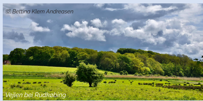
Bettina Klem Andreassen

Südlich von Rudkøbing liegt noch ein Wiesengebiet, Rudkøbing Vejle, von Stadt und Wald umgeben. Sehen Sie sich den markierten Wanderweg auf der Karte an, um das Gebiet zu überqueren. Vejlen ist ein flaches und feuchtes Gebiet, das ursprünglich ein offener Meeresarm war, bis man 1824 einen Damm mit einer Pumpe baute. Dieses hatte zur Folge, dass die Wiesen ausgetrockneten und als Ackerland dienen. 1995 hörte das Trockenlegen auf und die Feuchtwiesen wurden zum großen Nutzen für Fauna und Flora wiederhergestellt. Rudkøbing Fredskov grenzt an die Vejle und war von 1876 bis 1957 ein Ausflugsziel für die Bürger der Stadt, die das kleine Sommerrestaurant mit Tanz und Bedienung mitten im Wald besuchten. Nun ist der etwa 17 ha große Wald Staatseigentum. Im Frühjahr bedeckt sich der Waldboden völlig mit Anemonen, Lerchensporn, Goldstern und dem stark duftenden Bärlauch.