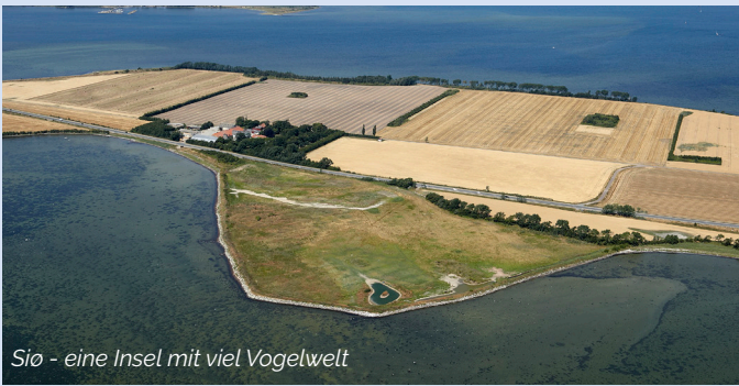
Sjø - eine Insel mit viel Vogelwelt