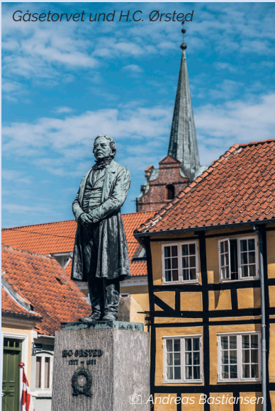
Gåsetorvet und H.C. Ørsted

wunderschön restauriert ist und jetzt als Pfarrhaus dient. Am Gåsetorvet steht die Statue des Chemikers und Physikers H.C. Ørsted (1777 – 1851). Gegenüber liegt sein Geburtshaus, die ehemalige Apotheke. H.C. Ørsted forschte auf dem weiten Gebiet der Chemie und Physik und wurde als Entdecker des Elektromagnetismus berühmt. Im H. C. Ørsted Museum können Sie mehr über H. C. Ørsted und seine Entdeckungen erfahren. Im Stadtzentrum finden Sie Langelands Museum mit interessanten Ausstellungen von Objekten aus der Urzeit bis zur Gegenwart.