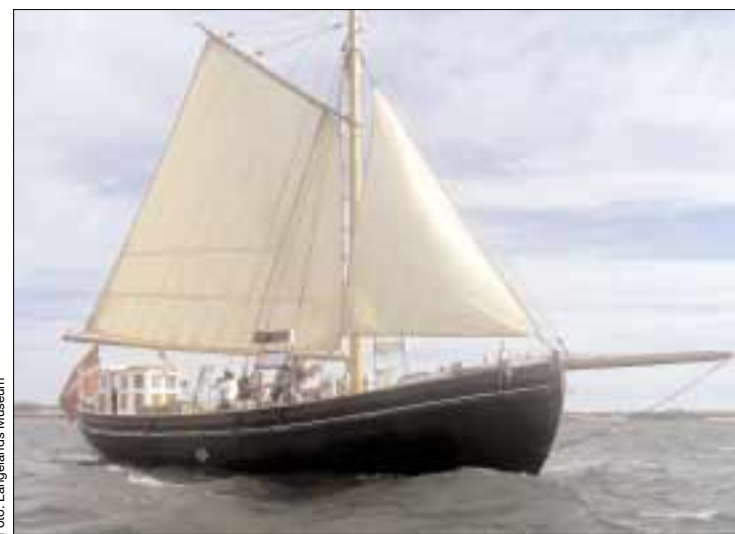
Der er mulighed for at opleve stemningen ombord på Mjølner, som sejler rundt i Øhavet.

Ristinge har helt fra den tidlige middelalder været et ind- og udskibningssted. Allerede i 1558 skulle varer fortolde i Rudkøbing. Rudkøbing-borgerne søgte mange gange i historiens løb at få nedlagt ladestedet. Kronen og senere Grevskabet Langeland havde stor interesse i at bevare ladestedet til udførsel af korn og træ udenom Rudkøbing. Det gamle færge- og ladested kan stadig erkendes som nogle store sten i vandet nord for Ristinge By udfor færgegården. Med den afsides beliggenhed var stedet i ældre tid kendt som et yndet smuglersted.