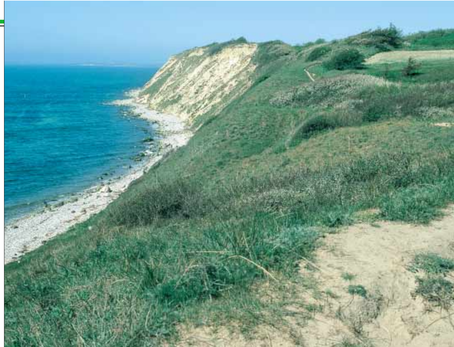
Ristinge Klint, hvorfra man har en flot udsigt over Det Sydfynske Øhav