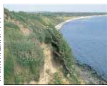
Udsigt fra klinten ned mod stranden