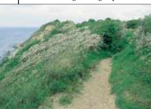
Sti langs klintens overkant

Det offentlige har sammen med ejerne også etableret en sti videre så man har mulighed for at opleve nordsiden af halvøen og Ristinge Nor.