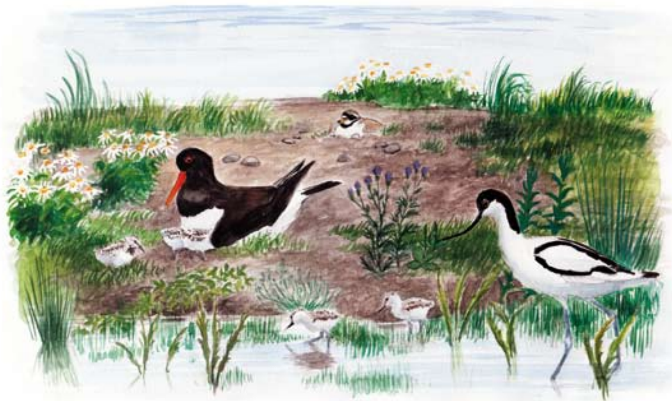
Strandskade og klyde med unger på en af de kunstige øer. Bagved ligger stor præstekrave på reden.