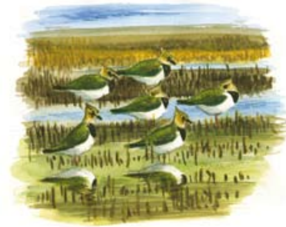
Viberne har brug for et lysåbent landskab.

De steder hvor kreaturerne er kommet for langt bagud, er det nødvendigt at fjerne træer og buske. I 2008 er gravhøjskomplekset Trehøje derfor blevet helt ryddet for træer og buske.