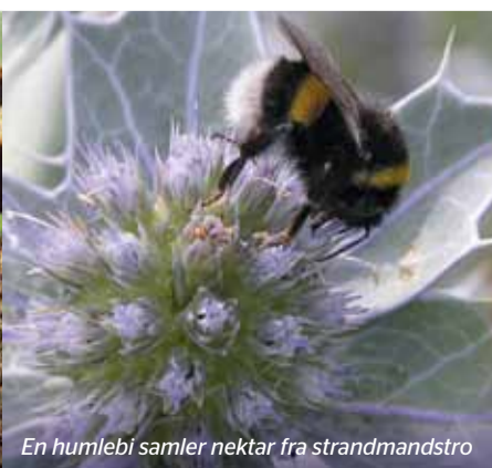
En humlebi samler nektar fra strandmandstro

På det sandede strandoverdrev ved Mindet i Madens nordlige del, vokser den gråblå strandmandstro , som med sine stive stængler og læderagtige blade kan modstå det barske og salte vejrlig ved havet. Både strandmandstro og majgøgeurt er fredet, og må ikke plukkes.