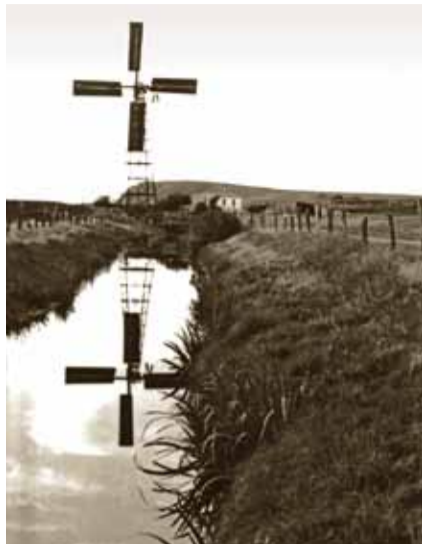
Vindmotor og pumpehus. Foto fra 1950'erne, venligst udlånt af Helnæs Lokalhistoriske Arkiv.

I stenalderen stod havet højt, og Helnæs Made var en lavvandet vig. Havstrømme fra syd har i læ af Lindehoved aflejret sten og grus i volde. Disse strandvolde er bygget uden på hinanden mod nord, og til sidst er vigen blevet til en strandsø. Strandvoldene krummer indad og kan stadig ses i terrænet, når man går på det yderste af Maden. Visse steder er de dog udviskede, da her er gravet skaller, ral og tørv.