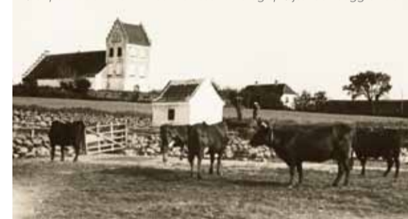
Køer på Maden i 1914 med Helnæs Kirke og sprøjtehus i baggrunden

Kort fra 1769. Indtil midten af 1700-tallet kunne Helnæsboerne sejle helt ind til Helnæs By. Holmene i vigen blev brugt til græsning af kreaturer, og der var et godt ålefiskeri i vigen, heraf navnet Åledybet. I 1780'erne blev de naturlige strandvolde udbygget, og der blev lavet en sluse, så man kunne holde det meste af vandet ude fra Maden. Senere benyttede man vindmøller til at pumpe vandet fra Maden ud i Lillebælt. Nu kunne de tidligere strandenge opdyrkes. I 2013 har projekt LIFE Helnæs igen hævet vandstanden på Maden, dyrkningen er ophørt, og kreaturer afgræsser hele det store område.