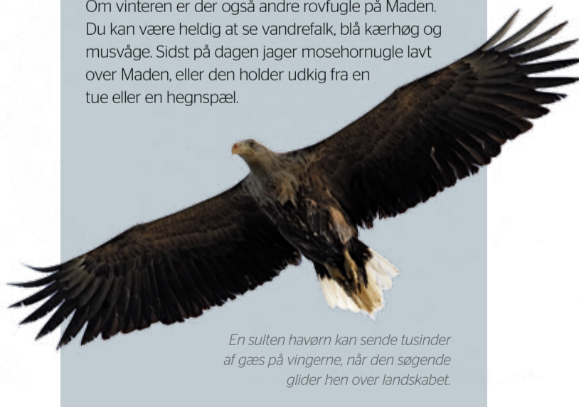
En sulten havørn kan sende tusinder af gæs på vingerne, når den søgende glider hen over landskabet.

Om vinteren er der også andre rovfugle på Maden. Du kan være heldig at se vandrefalk, blå kærhøg og musvåge. Sidst på dagen jager mosehornugle lavt over Maden, eller den holder udkig fra en tue eller en hegnsplæl.