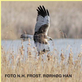
RØRHØG HAN