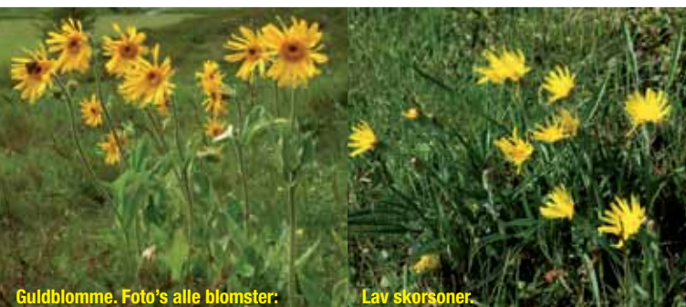
Guldblomme. Foto's alle blomster:

ejes og drives af Naturstyrelsen Midtjylland. Mere information findes på www.naturstyrelsen.dk/Lokalt/Midtjylland/, tlf. 75 80 00 07.