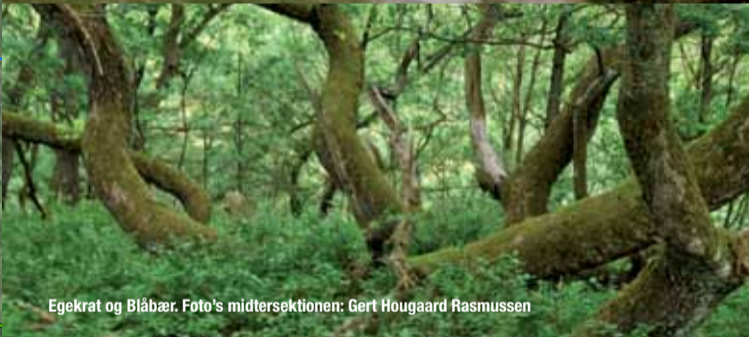
Egekrat og Blåbær.