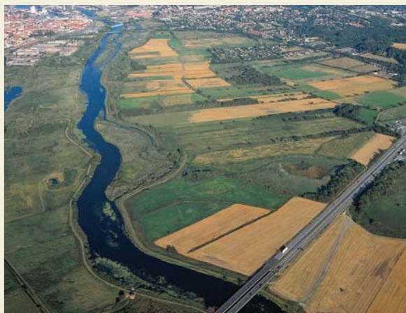
Vorup Enge set mod øst inden vådområdets etablering

På pavillonen i den østlige ende af området vil der være opslag omkring arrangementer og hvornår guiderne træffes i området. Disse informationer vil også være tilgængelige på Randers Regnskovens hjemmeside www.regnskoven.dk/VorupEnge .