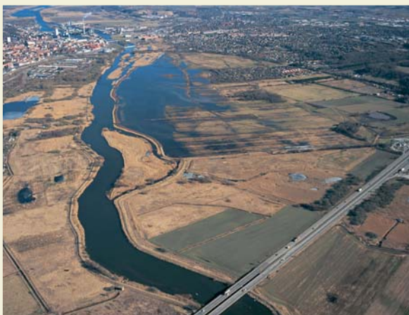
Vorup Enge set mod øst med vådområdet ved lav vandstand