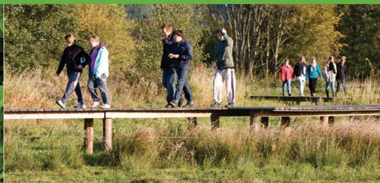
Gangbro på stien langs med Kongens Kær