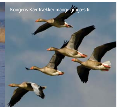
Kongens Kær trækker mange grågæs til