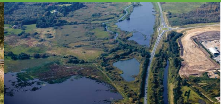
Kongens Kær og Knabberup Sø set fra oven