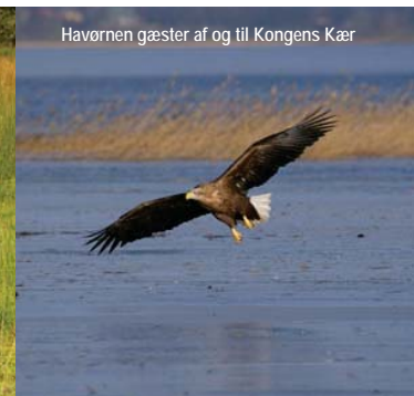
Havørnen gæster af og til Kongens Kær