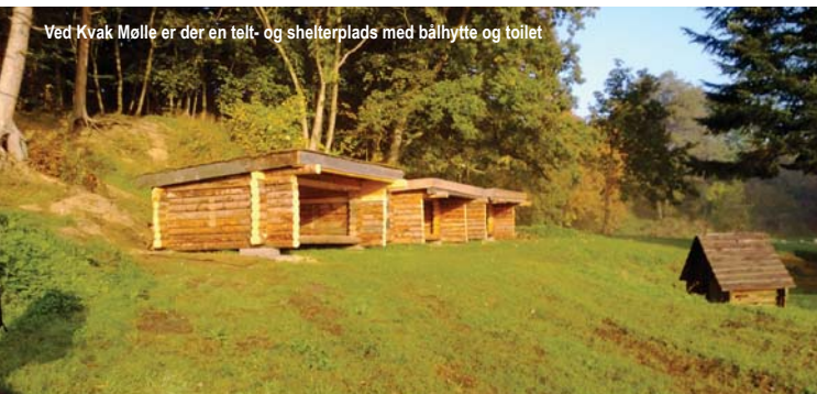
Ved Kvak Mølle er der en telt- og shelterplads med bålhytte og toilet

2 Haraldskær-Helligkilde Skov-Haraldskær Fabrik . 6 km cykeltur. Fra Avlsgården følges Møllevejen langs de stynede popler forbi ruinen af Kvak Mølle. Videre ad Fabriksvejen gennem Helligkilde Skov med kildebrønd og afvekslende skov, forbi Haraldskær Fabrik og Dronningens Mose, hvor moseliget af dronning Gunhild lå, og retur i det åbne herregårdslandskab.