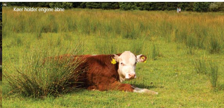
Kær holder engene åbne