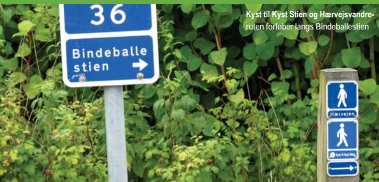
Kyst til Kyst Stien og Hærvejsvandrøruten forløber langs Bindeballestien