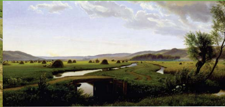
P.C. Skovgaard: "Den store eng ved Vejle. Sommereftermiddag 1867". Tilhører Vejle Kunstmuseum.

Der var liv og glade dage på Himmelpind i midten af 1900-tallet. En af landets mest populære