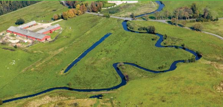
Den genslyngede å ved Haraldskær, hvor man stadig kan se de lige afvandingskanaler

væk i 30-35 år, og når den nu er vendt tilbage, er det, fordi mange års naturforbedringer af åen har båret frugt. Der lever skønsmæssigt 40-50 oddere i Vejle Ådal.